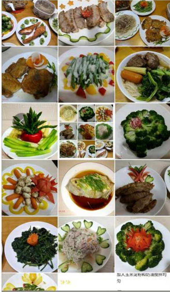
加入玉米淀粉和奶漬攪拌均勻